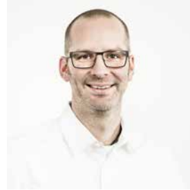
Clemens Graf Professional Services