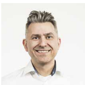
Patrick Peters Professional Services